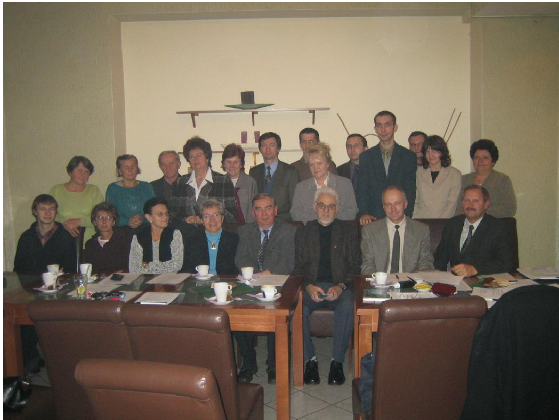
Na podstawie: Marian F. Nowak, Kronika Ostrowskiego Towarzystwa Genealogicznego , [w:] „Rocznik OTG” t. I/2006, s. 123–125.